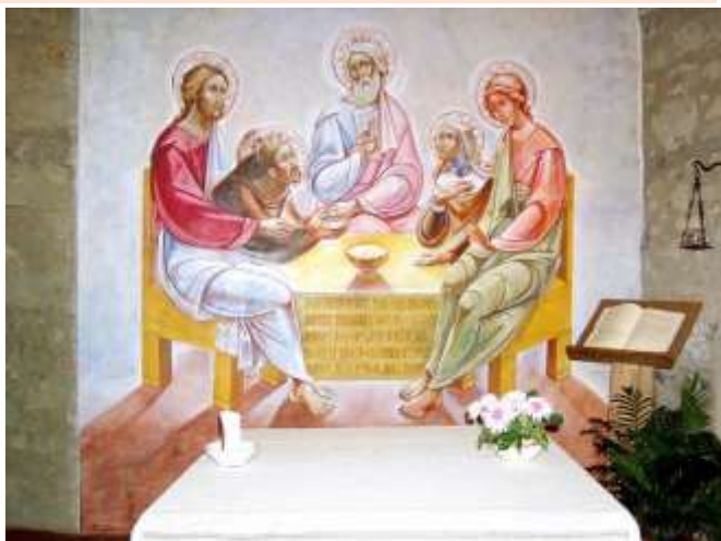
Sveta Trojica s svetim Frančiškom in sveto Klaro v eremu Celice pri Cortoni.

Vodilo in življenje Frančiškovih bratov in sester v svetu je: izpolnjevati evangelij našega Gospoda Jezusa Kristusa po zgledu svetega Frančiška Asiškega, ki ga je Kristus navdihoval in mu bil središče življenja z Bogom in ljudmi. Kristus, dar Očetove ljubezni, je pot k Očetu; je resnica, v katero nas uvaja Sveti Duh, in je življenje, za katero je prišel, da bi nam ga dal v izobilju.